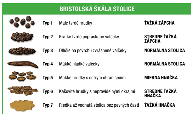
Obrázok 2: Podľa bristolskej škály stolice sa pri type 5 až 7 hovorí ako o hnačke, pri 1 a 2 ako o zápche.

Pri klasifikácii stolice sa používa tzv. bristolská škála stolice. Podľa nej sa za hnačku považuje typ 5 až 7. Typ 5 je charakterizovaný stolicou vo forme hladkých mäkkých guľičiek s jednoznačne ohraničenými okrajmi, čo symbolizuje skrátenú pasáž črevného obsahu (mierna hnačka). Najčastejšie je vyvolaná dietetickým pochybením a/alebo nedostatočnou konzumáciou vlákniny.